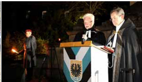
Ökumenisches Gebet für den Frieden in Floß.