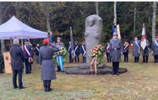
Mahnung zum Frieden am Volkstrauertag in Flossenbürg.

Jesus Christus: „Selig sind, die Frieden stiften; denn sie werden Gottes Kinder heißen.“ (Matthäus 5,9)