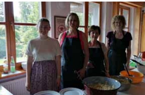
„Was darf's sein?“ – „Lasst's euch schmecken!“