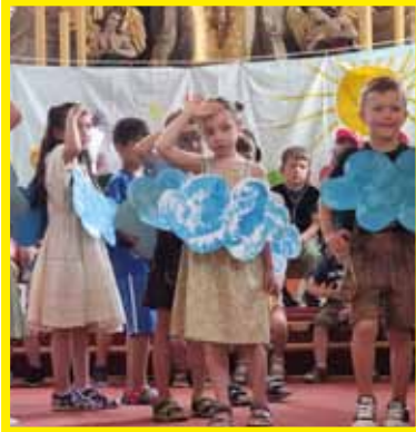
„Puh, es war sehr heiß“