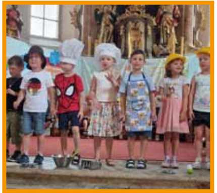
„Wer will fleißige Handwerker sehn?“