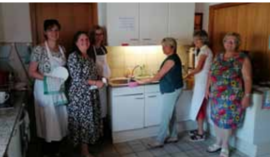
„Viele Händ', machen schnell a End.“