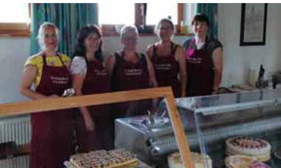
„Aber bitte mit Sahne!“