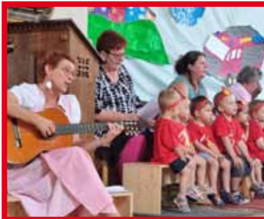
„Mit Musik geht alles besser“