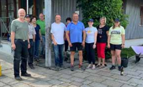
„Vorbereitungen rund um's Gemeindehaus“