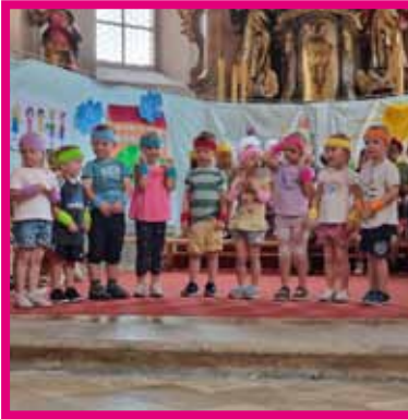
„Fit durch den Sommer“