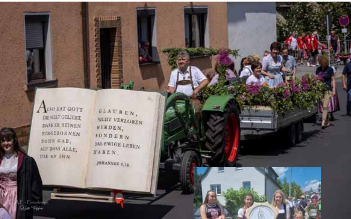
Festwagen der Flosser Kirchengemeinde beim großen Festzug am 11. Juni. Rechts die Schildträgerinnen.

Es gibt die alte Streitfrage zwischen Floß und Flossenbürg: Wer war zuerst da? Aber die Frage ist müßig. Keine der beiden Ortschaften war „zuerst“ da. Die Bau- ern in den Dörfern und in den Weilern waren zuerst da. Mit ihrem Pflug haben sie das Land eingenommen. Das ging die Floßtäler hinauf. Mit der Zeit wurden es mehr. Sie brauchten Schutz. Und so kam die Burg. Dann brauchten sie auch einen Ort zum Handel, zum Tausch, zum Kauf und Verkauf. Und so entstand Floß.