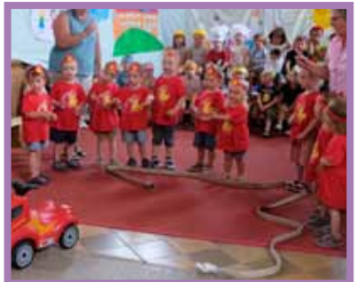
„Wir löschen, wenn's zu heiß wird!“